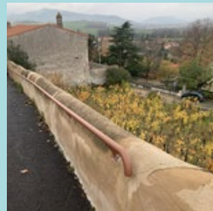
Rampe côte de peine