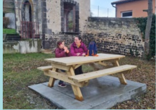
Mobilier urbain devant la mairie secteur Dallet.

Le service technique est un maillon primordial dans l'entretien du village et donc de l'image qu'en ont administrés et visiteurs. Il gère l'entretien courant des espaces verts, des 3 écoles, des bâtiments communaux y compris le complexe sportif, des chemins et voies, l'astreinthe hivernale du 14 novembre au 19 mars, etc. Le service technique réalise différents aménagements dont : pose du mobilier urbain devant la mairie de Dallet (cf photo), une allée béton pour l'accès au poulailler de l'école maternelle de Mezel (cf photo), fabrication et pose d'une rampe côte de peine (cf photo).