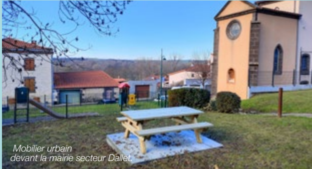
Mobilier urbain devant la mairie secteur Dallet.