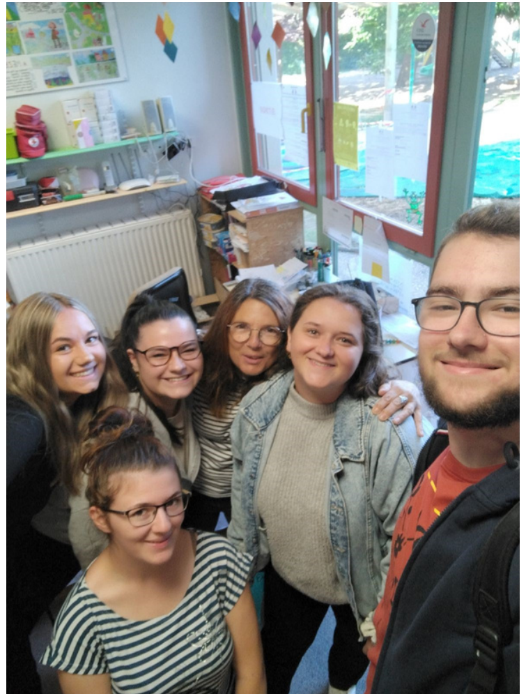
Equipe secteur Mezel