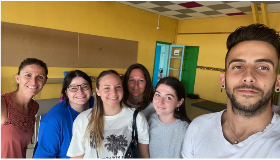
Equipe secteur Dallet